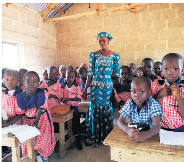
Også en skoleklasse med plads til 1000 elever var blevet bygget med støtte fra Sørensen far.

Søren Sejersen er landmand og havde dengang egen gård og stor svinebedrift, men efter nogle lidt for optimistiske investeringer under finanskrisen, som ikke kunne tjene sig selv hjem igen, var han nødsaget til at sælge alt og flytte i lejlighed.