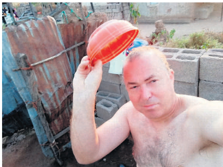
Badeforholdene var noget anderledes, end Søren var vant til.